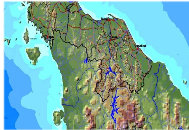
ภาพที่ ๒ แสดงลักษณะภูมิประเทศของจังหวัดยะลา